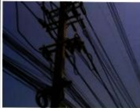
ภาพที่ 1 ก่อนการแก้ไข (ภาพจริง)